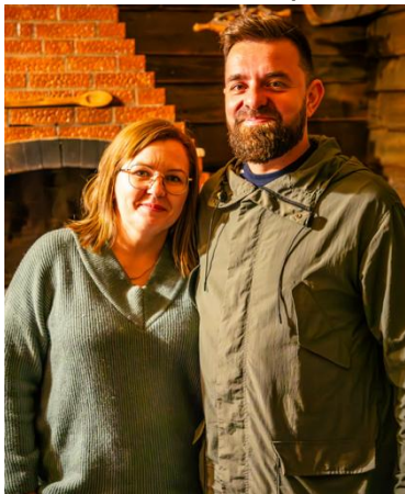
(cc) C. Maier (=ND)