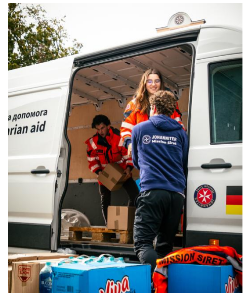
(cc) C. Maier (=ND)