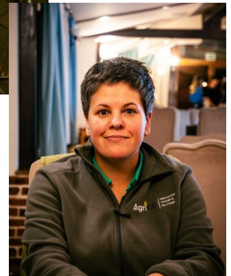
(cc) C. Maier (=ND)