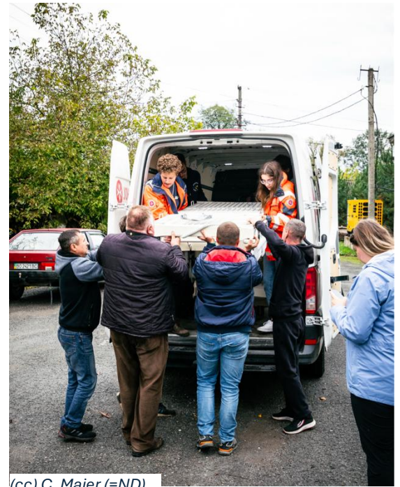
(cc) C. Maier (=ND)