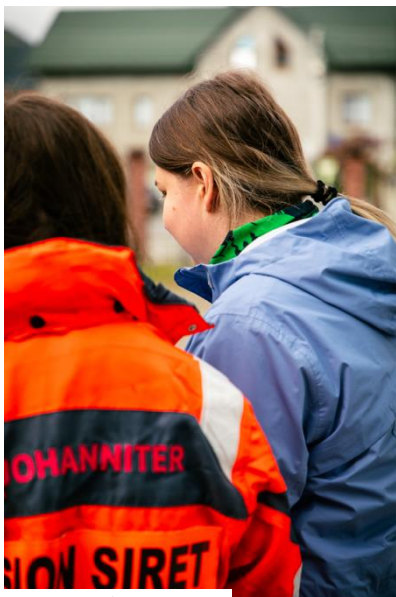
(cc) C. Maier (=ND)