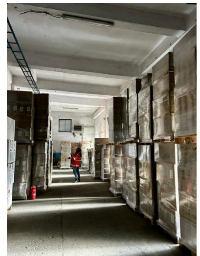
(cc) Mission Siret