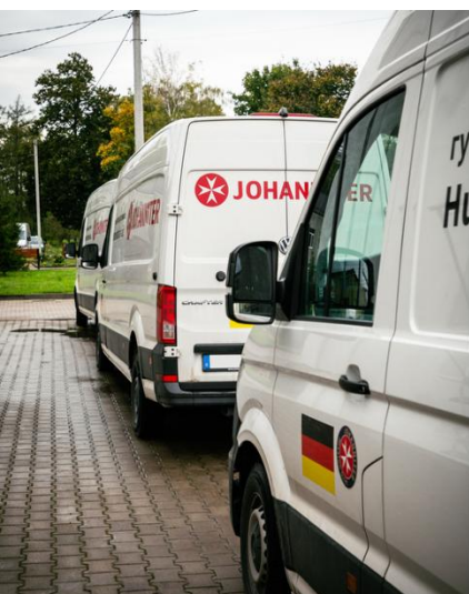
(cc) C. Maier (=ND)