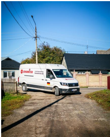
(cc) C. Maier (=ND)